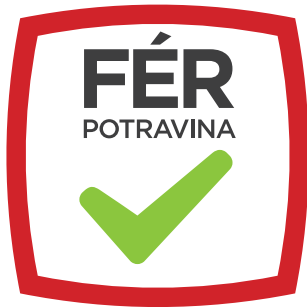
varianta s doplňkovým sloganem (extended)