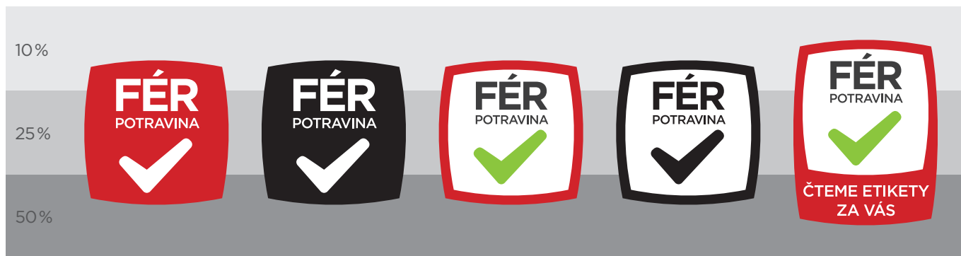
A) Použití pozitivních variant