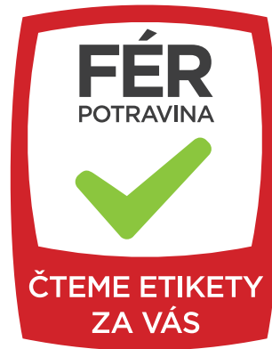
varianta s doplňkovým sloganem (extended)