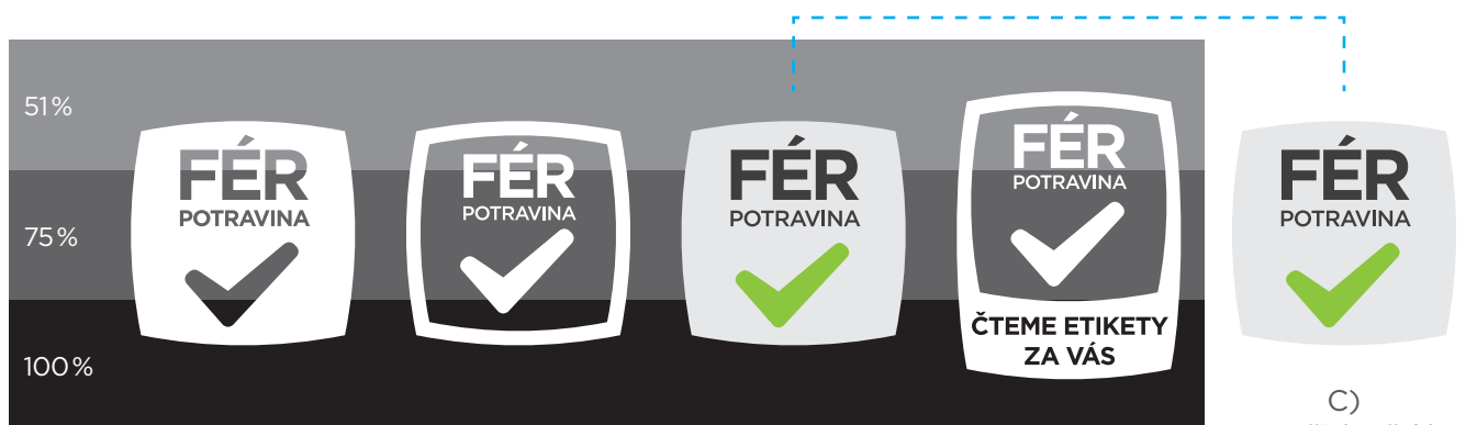
B) Použití světlé varianty a negativních variant